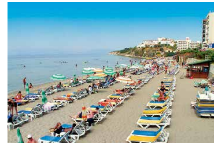
Ylhäällä: Efesos. vasemmalla: Kusadasin ranta. Oikealla: Lintusaari.

Kusadasista löytyy useita hyviä ravintoloita, erityisesti vanhasta kaupungista. Vieraile esimerkiksi Erzincan ravintolassa, joka on yksi Kusadasin pienistä, tunnelmallisista ravintoloista. Satamasta löytyy monia hienoja ravintoloita, joissa tarjoillaan fantastisia kala- ja äyriäisvaihtoehtoja. Niin kutsuttu baarikatu vanhassa kaupungissa on usein kehuttu vilkkaasta yöelämästään. Täältä löytyy yökerhoja, jotka ovat auki pitkään. Sataman baareissa ja ravintoloissa soitetaan usein live-musiikkia.