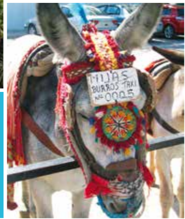
Ylhäällä: Malaga Vasemmalla: Aasitaxi Mijaksessa Alhaalla: Gibraltar

All Inclusive-lomat upeaan Costa del Soliin ovat vuoden suuri uutuuus. Espanjan Aurinkorannikolle tulo tarkoittaa kauniita maisemia, maukkaita ruokaelämyksiä ja mukavia kohtaamisia paikallisten kanssa. Voit myös tutustua rikkaaseen kulttuuriperintöön, upeisiin rantoihin ja idyllisiin maalaiskyläihin.